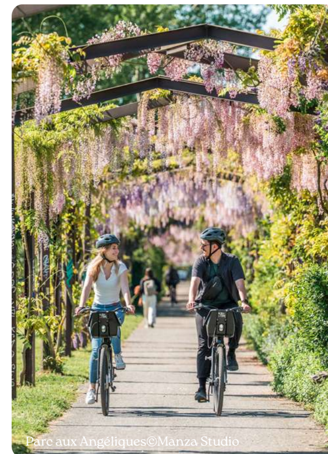
Parc aux Angéliques

Perfecta para combinar naturaleza, diversión y descubrimiento del patrimonio, Terra Aventura es una búsqueda del tesoro de «geocaching».. ¡Una actividad divertida y gratuita al aire libre!