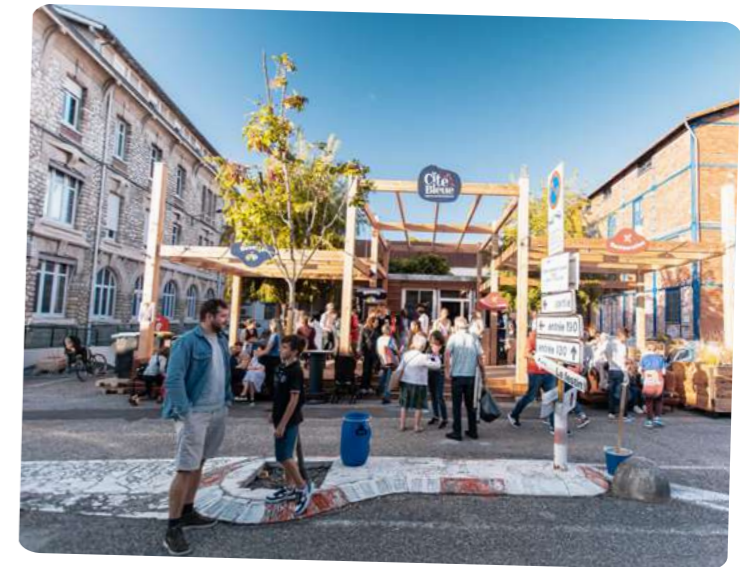
La Cité du Bleue

Recién instalado a orillas del Garona, Le Bien Public es un espacio que combina restaurante, cervecería cultural, sala de conciertos y club y zonas expositivas. ¡Un concepto híbrido al servicio de la cultura, la fiesta y las experiencias culinarias! Además, cuenta con una terraza con vistas panorámicas a la margen izquierda de Burdeos.