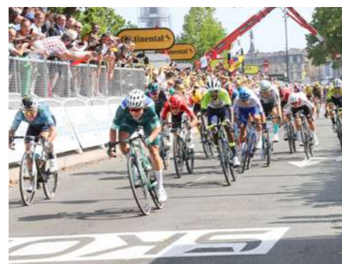
TDF2023@TS-mairie de Bordeaux

Del 7 al 11 de julio de 2027, Burdeos acogerá la primera etapa de la Tall Ships Races 2027, la reconocida regata internacional de grandes veleros. Para este excepcional evento náutico, el festival enoturístico Bordeaux Fête le Vin se unirá a las festividades, creando un evento único en la encrucijada de las culturas del vino y el mar: Velas y Vinos. Alrededor de cuarenta veleros excepcionales, procedentes de todo el mundo, harán escala en el Puerto de la Luna durante cinco días de festividades y actividades gratuitas y abiertas a todos, celebrando el patrimonio marítimo y vinícola, así como el espíritu del mar. ¡Nos vemos a orillas del Garona en julio de 2027! Después de Burdeos, la regata hará una parada a Coruña, España.