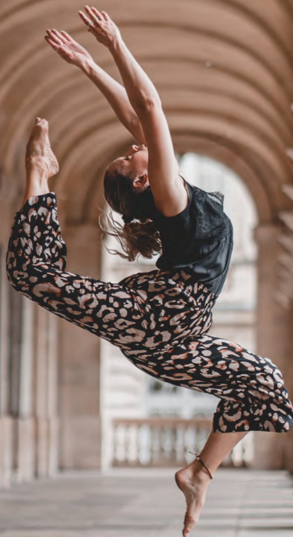
Grand Théâtre

Entre tierra y océano, Burdeos es también la puerta de entrada a todo el suroeste de Francia y la vecina de destinos con múltiples encantos. Respirar el aire fresco del mar, escalar la duna más alta de Europa, viajar en el tiempo a través de históricas ciudades fortificadas, practicar el surf... Encontrará numerosas opciones de viajes y descubrimientos al alcance de la mano en la bahía de Arcachón, las playas del Atlántico, el bosque de las Landas, el corazón de la Dordoña o incluso el País Vasco francés.