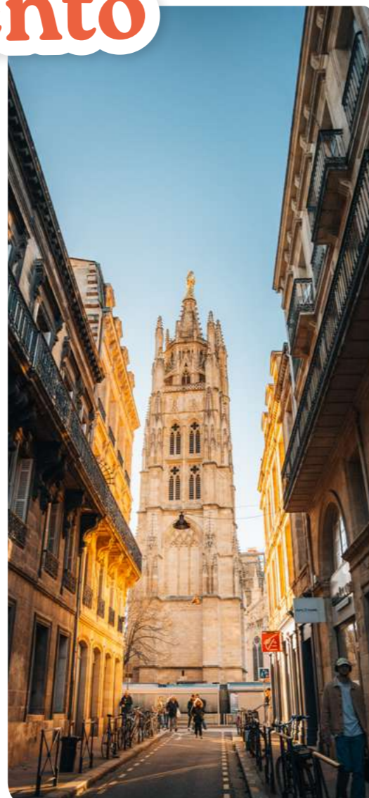
Tour Pey Berland

Lo que más me gusta de mi trabajo son esos momentos en los que comparto con los visitantes los secretos de Burdeos. Juntos descubrimos cómo la ciudad se ha adornado con una arquitectura tan armoniosa que le valió la declaración de Patrimonio de la Humanidad por la UNESCO en 2007. Ver cómo se les iluminan los ojos al comprender cómo el pasado da forma a lo que admiramos hoy... ¡Es también por estos momentos de intercambio y de compartir por lo que Burdeos me parece tan hermosa!